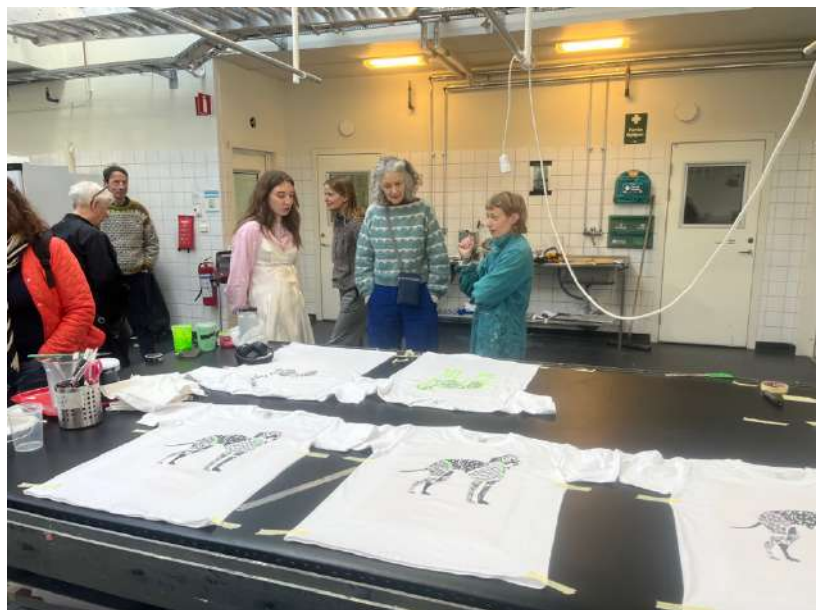
KONSTFACK TEXTILE PRINT WORKSHOP

I kan se hele programmet fra NTA-Making Loops på vores hjemmeside