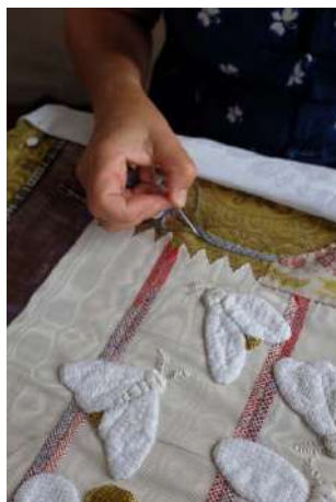
TABEA DÜRR, TALKING HANDS.