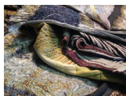
NORDIC TEXTILE MEETING IN BERGEN 30.3 - 3.4 2016 - THE VALUE OF TEXTILE ART/ADDED VALUES