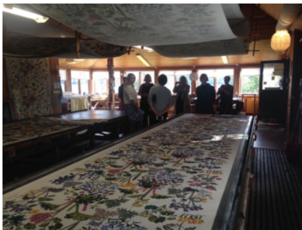
TEXTILE TALK/TALK TEXTILE, NÄTVERKSTRÄFF OCH WORKSHOP MED NTA OCH TEXO I RÄTTVIK. BESÖK PÅ JOBS HANDTRYCK