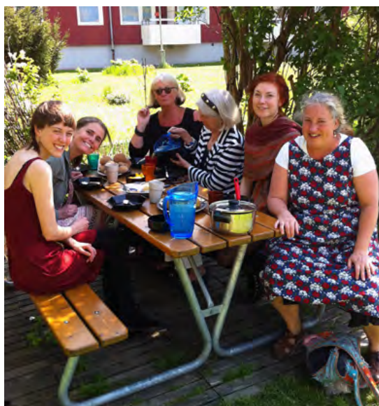
DELAR AV NTA STYRELSE 2013

Ekonomi har i år grundat sig på medlemsintäkter och riktade bidrag. Medlemsavgiften 2013 var 200 Skr för enskild person och 500 Skr för organisationer. NTA erhöll 35 000 dkk från Nordisk Kulturfond, 6000 euro från Kulturkontakt Nord och 25 000 dkk från A P Möller för projektet Nordiskt textilmöte i Köpenhamn Textil och arkitektur.